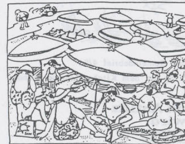
Das Erholamste am Urlaub...