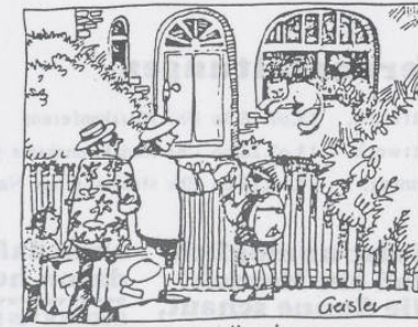
...ist manchmal das Heimkommen.